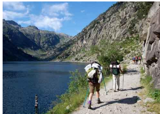
Valle de Boi, Pirineo Catalán