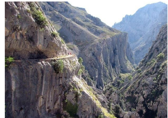
Ruta del Cares, Picos de Europa