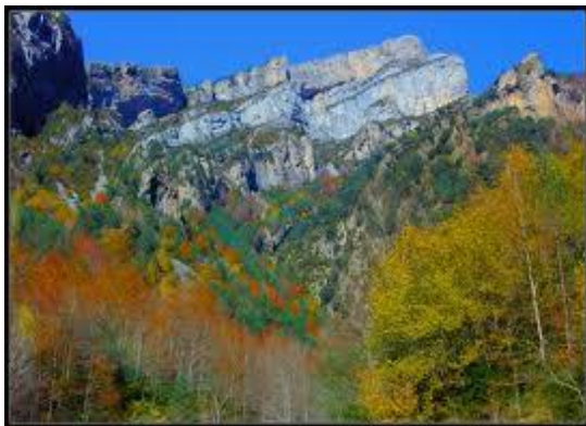
Canón de Añisclo, Pirineo de Huesca